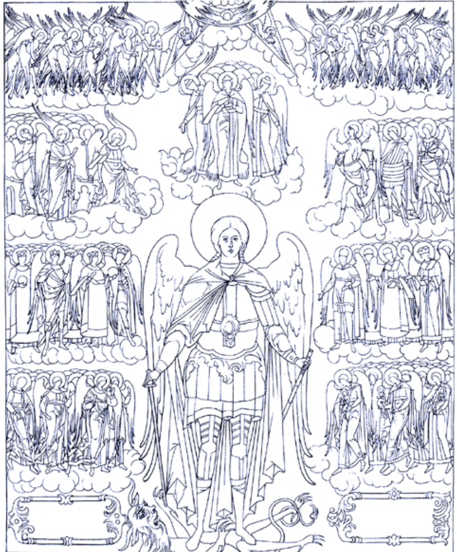
Говор Архангела Михаила и Небесных Сил. Россия. Лицевой иконописный подлинник Кондакова