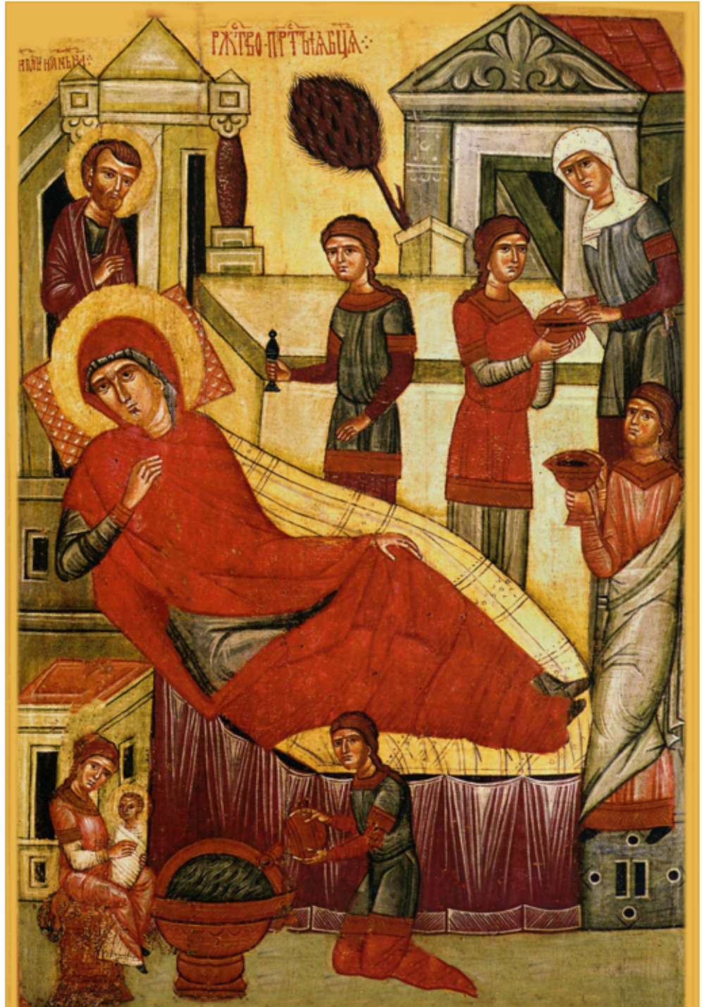
Рождество Богородицы, 14 век.

Государственная Третьяковская галерея. Москва