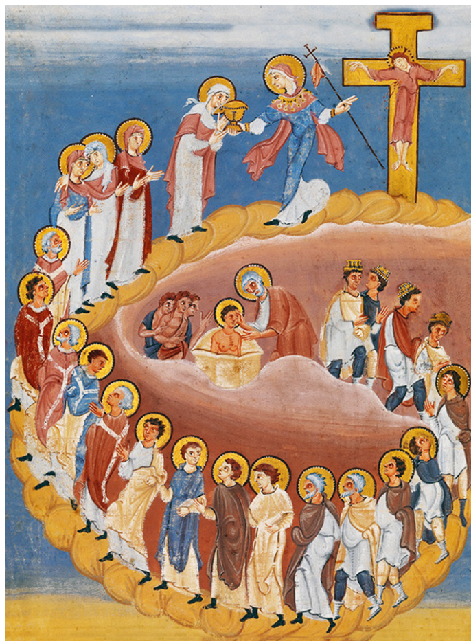
Шествия избранных от крещения до креста. X в. Песнь Песней и Книга Даниила с комментариями. Германия. Бамберг. Государственная Библиотека.

Нет, если только снова по-настоящему взглядеться в это, вслушаться, что-то странное тут происходит даже с самой религией. Как будто ничего не остаётся от самого ясного, привычного в ней – помощи, поддержки, гарантии. Поставил свечку, отслужил молебен или панихиду – и всё будет хорошо, и в жизни Бог поможет, да и там тоже, после страшной и таинственной смерти. Ведь разве не с таким упрощённым пониманием веры живет большинство самих верующих? Разве уже тогда, при Иисусе Христе, не ходили они толпами за Ним,