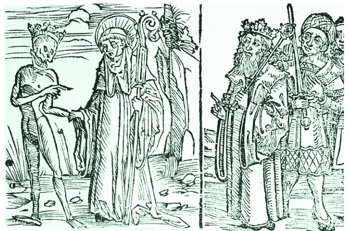
Фридолин приводит Урсо в суд в Ранхвайле. Деревянная гравюра «Житиях святых» Себастиана Бранта, 1513

Святой Фридолин сумел сделать монастырь на острове Зэкинген двойным, что вообще случается редко. Под его крышей жили как монахи, так и монахини, отделенные друг от друга глухой стеной.